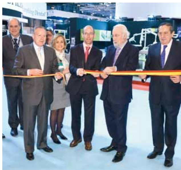
En un momento del acto de inauguración de la feria.

Entre las novedades presentes en esta edición de Expodental figuran los sistemas de diagnóstico por imagen 3D con mínimas dosis de radiación y con campos de visión ajustables a las necesidades de cada profesional o los desarrollos en sistemas digita-