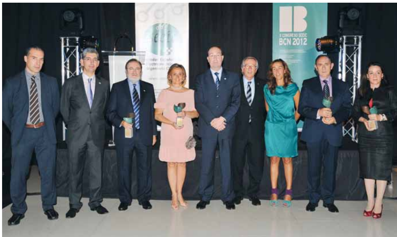
◉ Foto de familia de la entrega de los premios de la SEEIC.

Concluyó con un nuevo agradecimiento hacia todos los presentes reunidos en un entorno tan especial como la Sala Oval del Museo y en la cena de gala del X Congreso de la SEEIC. ◉