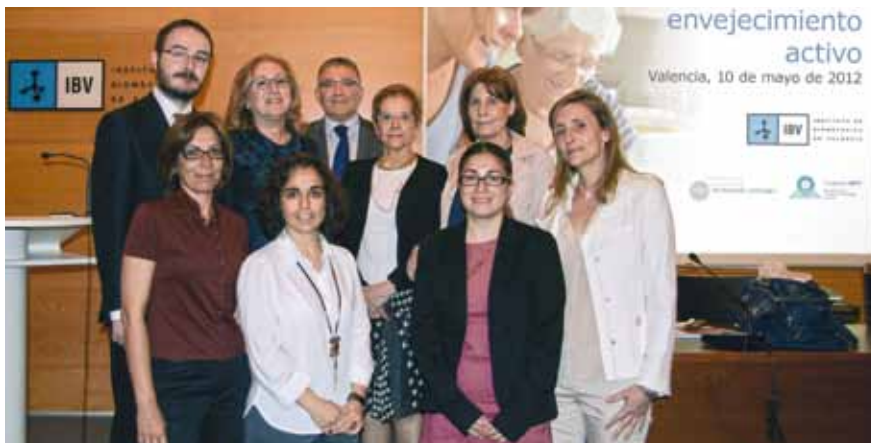
Presentación del estudio en el Instituto de Biomecánica de Valencia (IBV).

Este estudio, presentado a finales del pasado año en Madrid, incide en la necesidad de adaptar el diseño de productos y servicios a las personas mayores, un colectivo cada vez más numeroso y activo. Asimismo, las nuevas tecnologías deben dar respuesta a los proble-